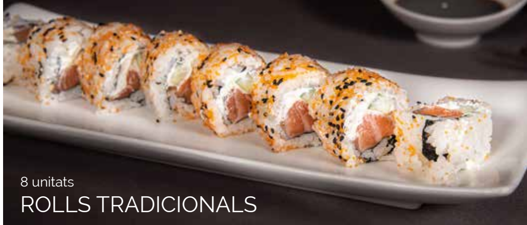
8 unitats ROLLS TRADICIONALS