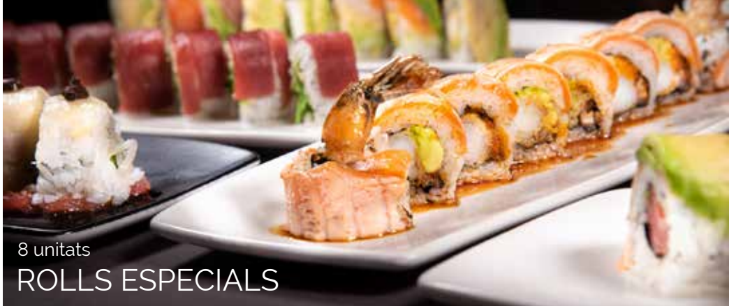
8 unitats ROLLS ESPECIALS