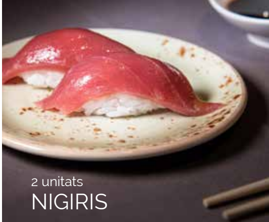
2 unitats NIGIRIS