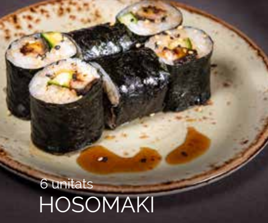
6 unitats HOSOMAKI