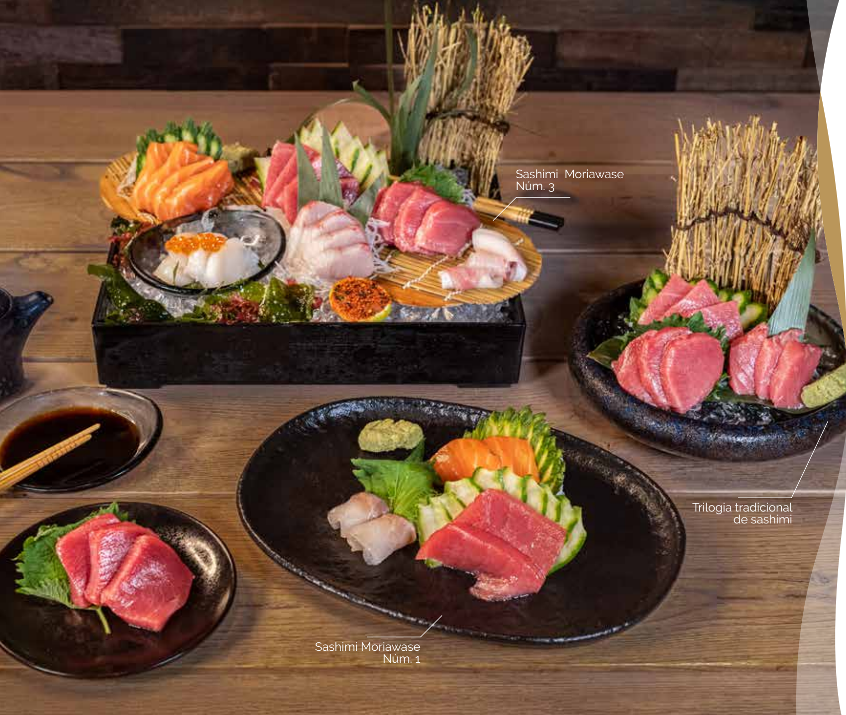
Sashimi Moriawase Núm. 3