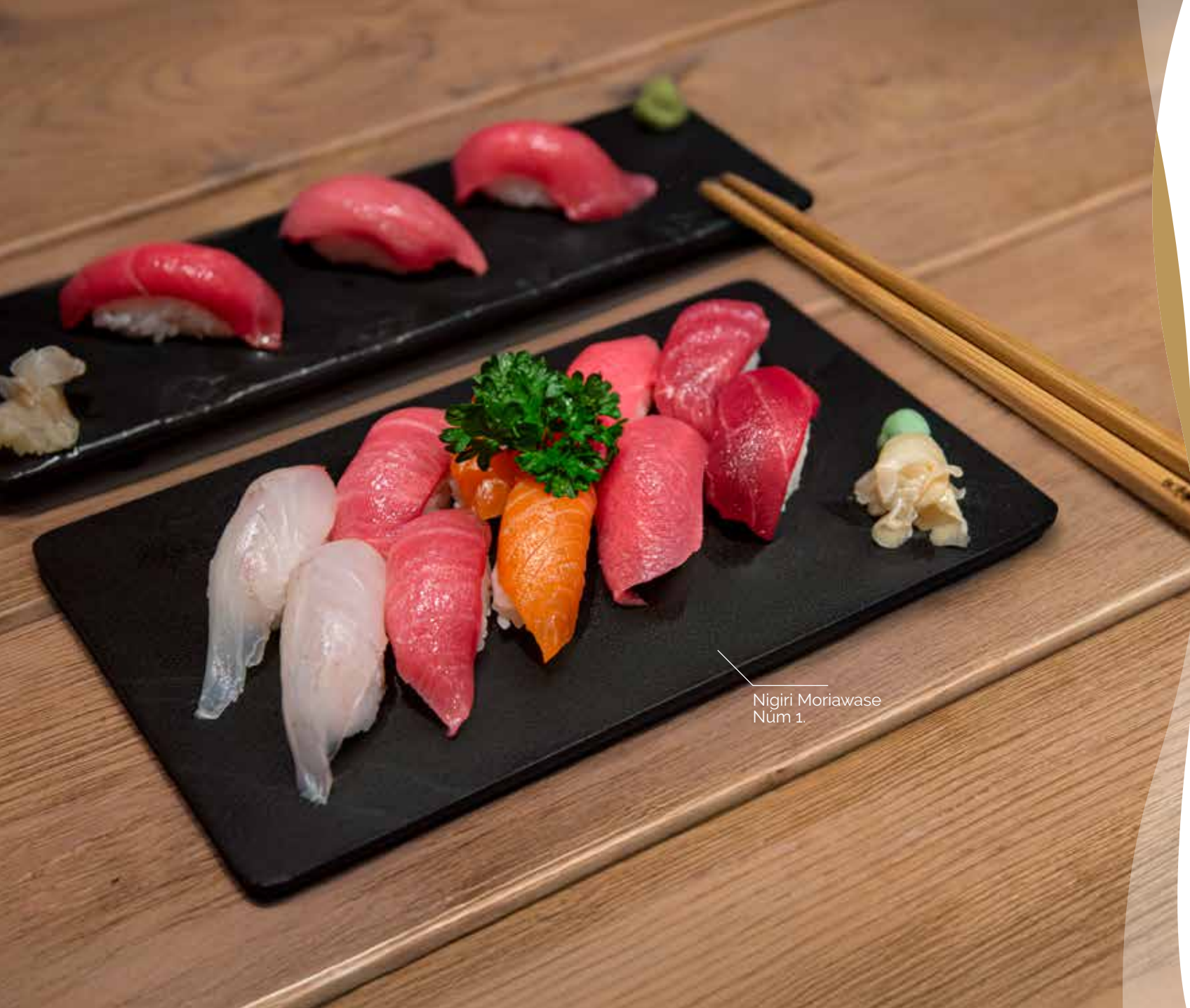
Nigiri Moriwase Núm 1.