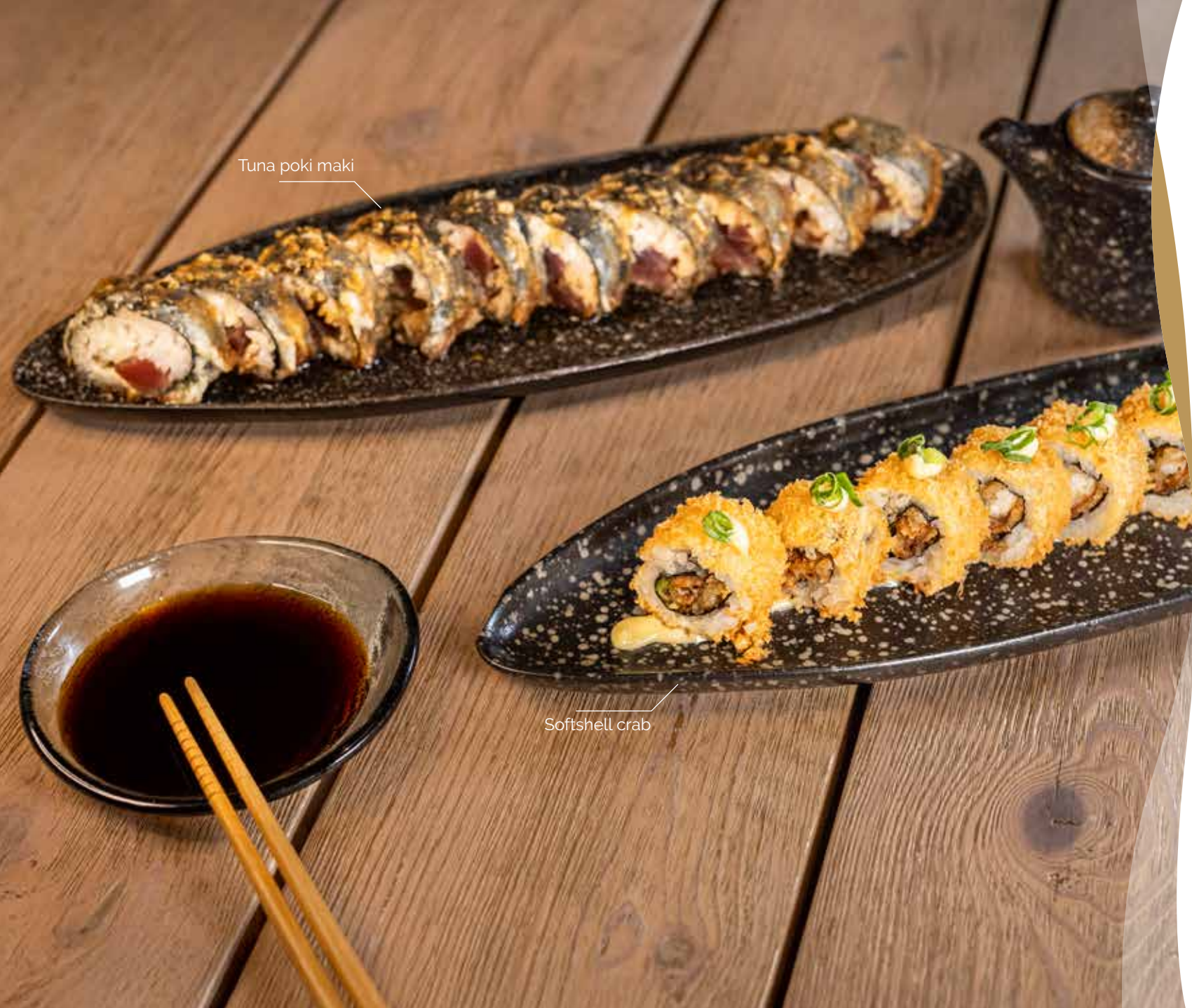
Tuna poki maki