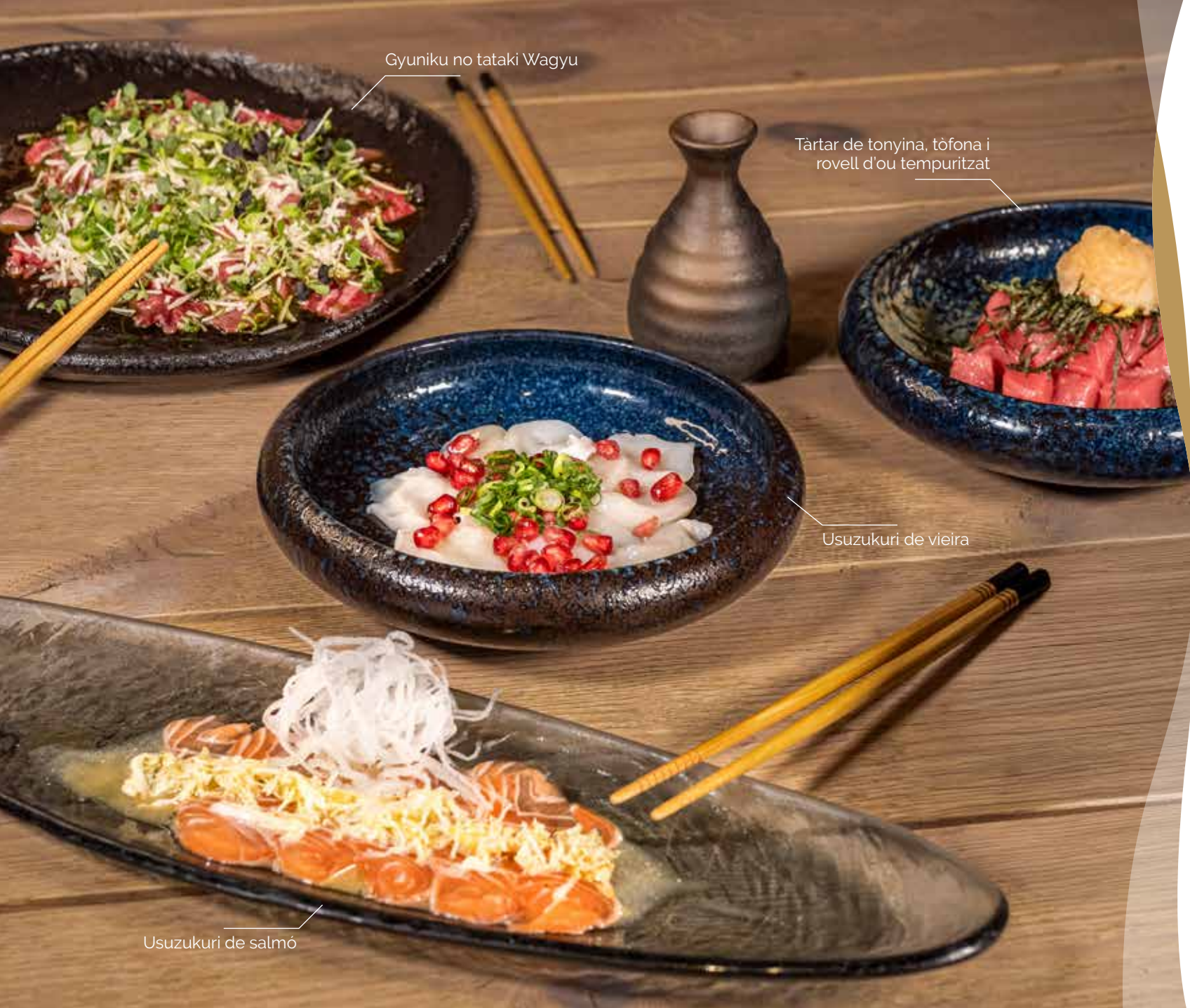
Gyuniku no tataki Wagyu