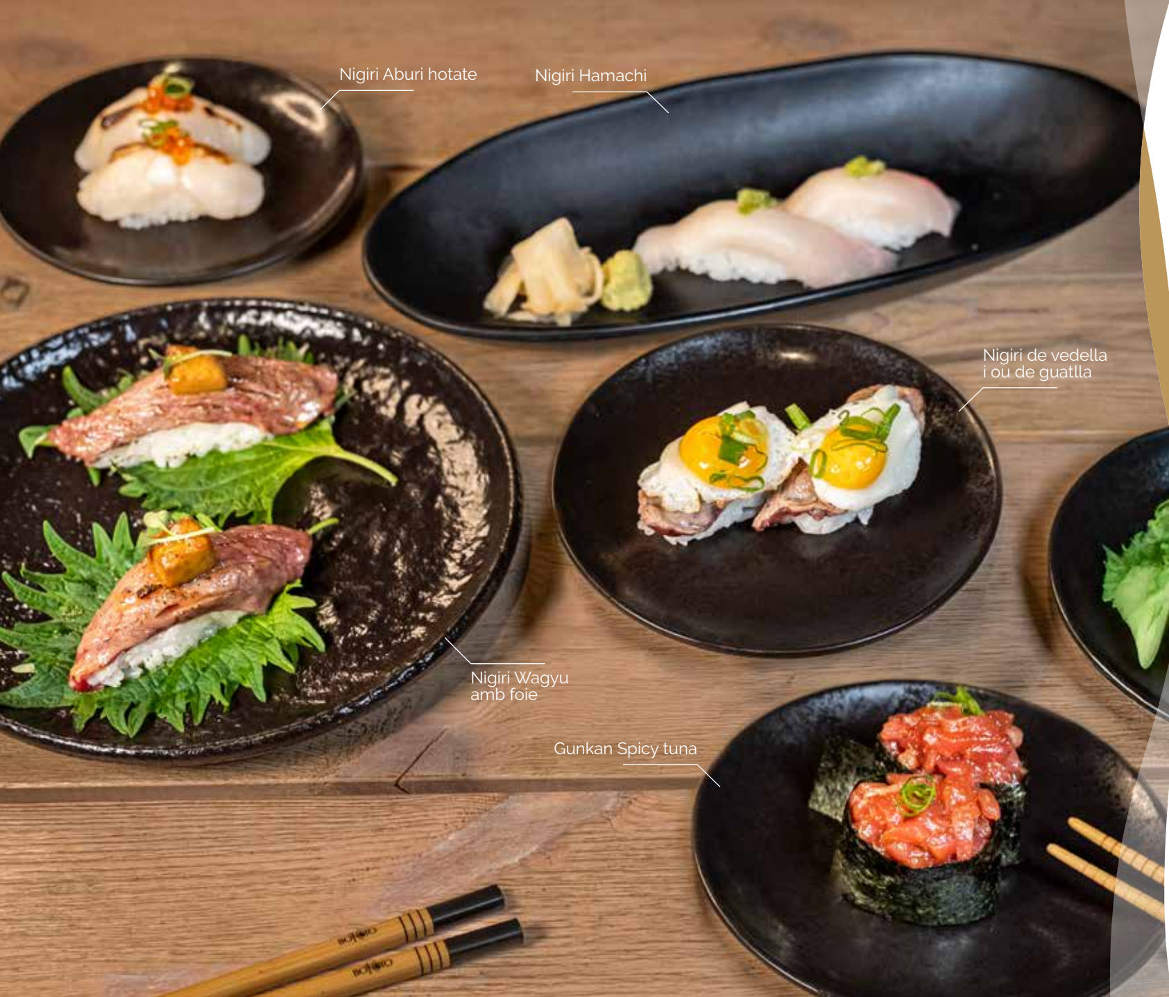
Nigiri Aburi hotate