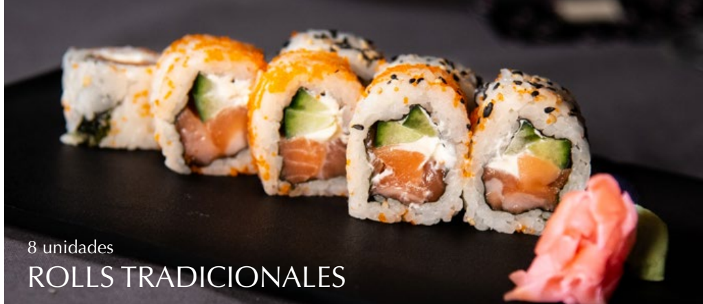
8 unidades ROLLS TRADICIONALES