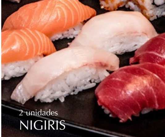
2 unidades NIGIRIS