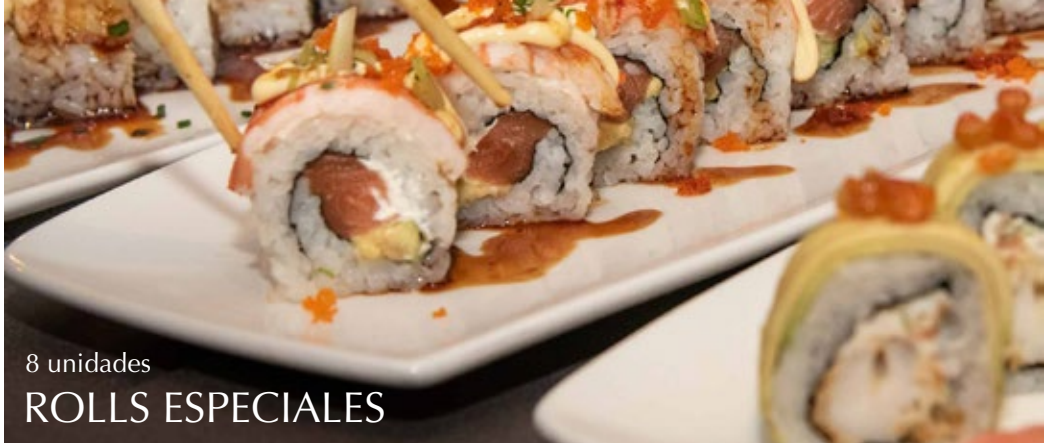
8 unidades ROLLS ESPECIALES