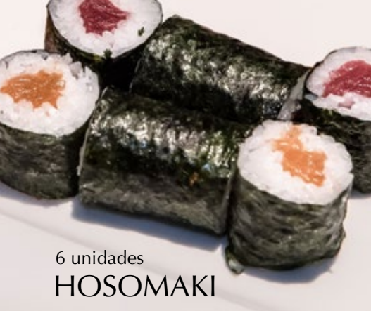
6 unidades HOSOMAKI