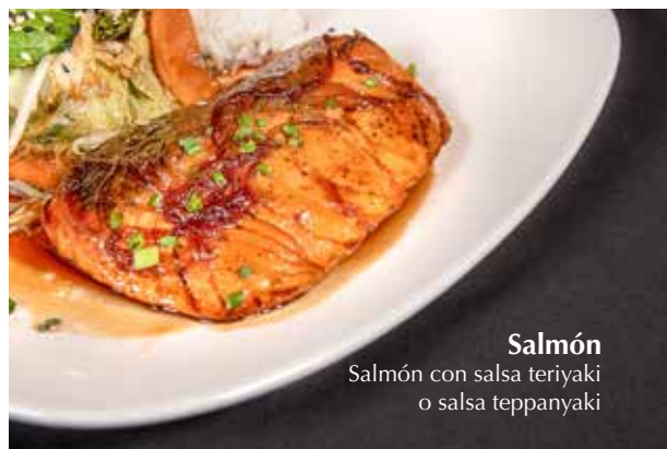
Salmón Salmón con salsa teriyaki o salsa teppanyaki