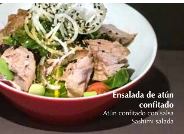
Ensalada de atún confitado Atún confitado con salsa Sashimi saladada