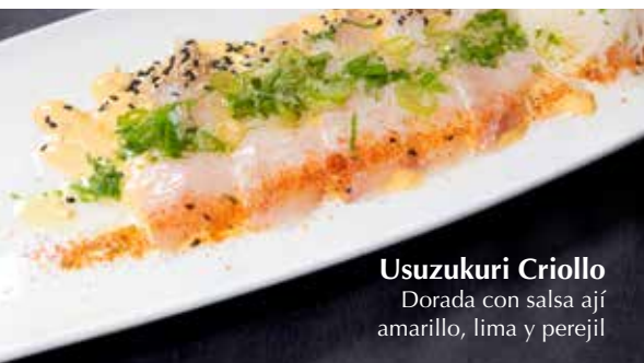
Usuzukuri Criollo Dorada con salsa ají amarillo, lima y perejil