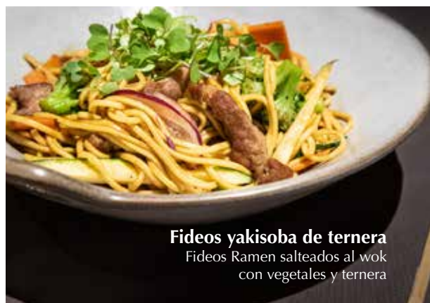
Fideos yakisoba de ternera Fideos Ramen salteados al wok con vegetales y ternera