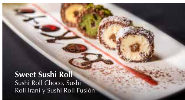
Sweet Sushi Roll Sushi Roll Choco, Sushi Roll Iraní y Sushi Roll Fusión