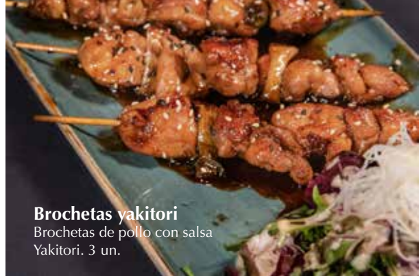
Brochetas yakitori Brochetas de pollo con salsa Yakitori. 3 un.