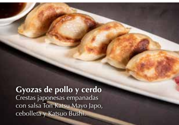
Gyozas de pollo y cerdo Crestas japonesas empanadas con salsa Ton Katsu Mayo Japo, cebollita y Katsuo Bushi.