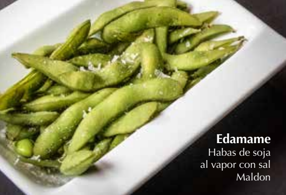
Edamame Habas de soja al vapor con sal Maldon