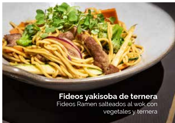
Fideos yakisoba de ternera Fideos Ramen salteados al wok con vegetales y ternera