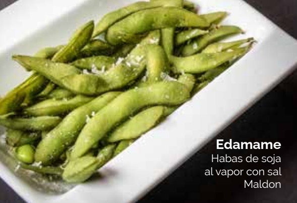
Edamame Habas de soja al vapor con sal Maldon