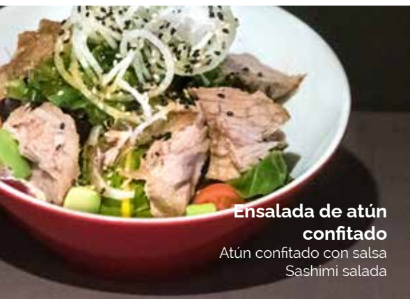
Ensalada de atún confitado Atún confitado con salsa Sashimi salada