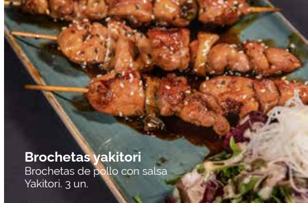
Brochetas yakitori Brochetas de pollo con salsa Yakitori. 3 un.