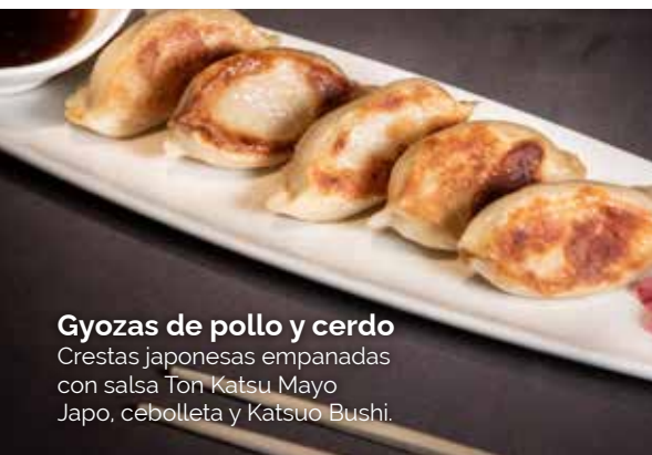
Gyozas de pollo y cerdo Crestas japonesas empanadas con salsa Ton Katsu Mayo Japo, cebolleta y Katsuo Bushi.