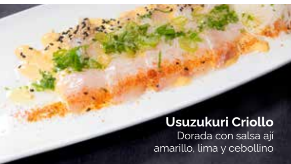
Usuzukuri Criollo Dorada con salsa aji amarillo, lima y cebollino