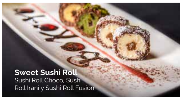
Sweet Sushi Roll Sushi Roll Choco, Sushi Roll Irani y Sushi Roll Fusión