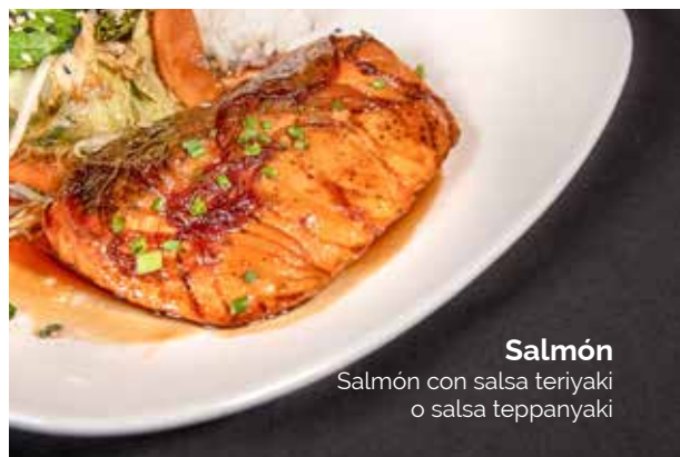
Salmón Salmón con salsa teriyaki o salsa teppanyaki