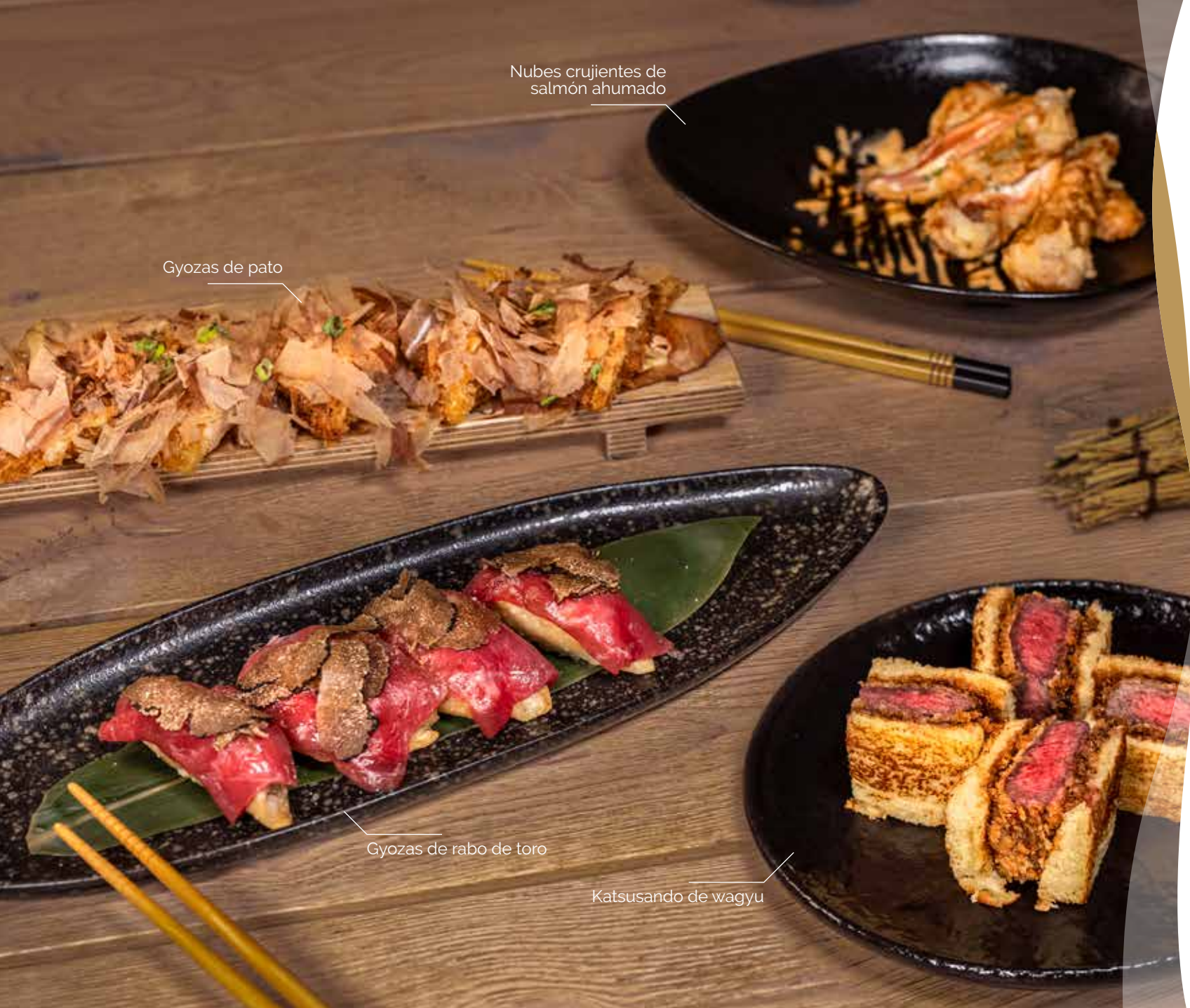
Nubes crujientes de salmón ahumado