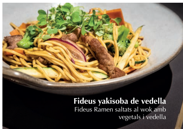
Fideus yakisoba de vedella Fideus Ramen saltats al wok amb vegetals i vedella