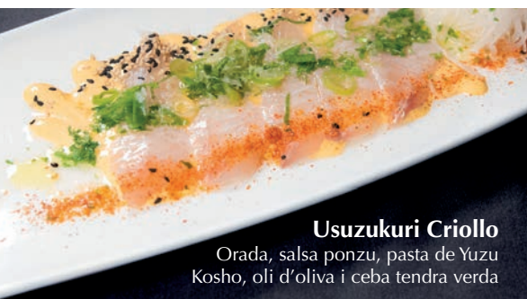
Usuzukuri Criollo Orada, salsa ponzu, pasta de Yuzu Kosho, oli d'oliva i ceba tendra verda