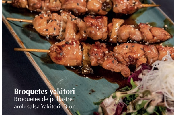
Broquetes yakitori Broquetes de pollastre amb salsa Yakitori. 3 un.