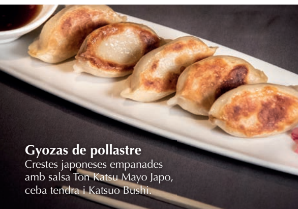
Gyozas de pollastre Crestes japoneses empanades amb salsa Ton Katsu Mayo Japo, ceba tendra i Katsuo Bushi.