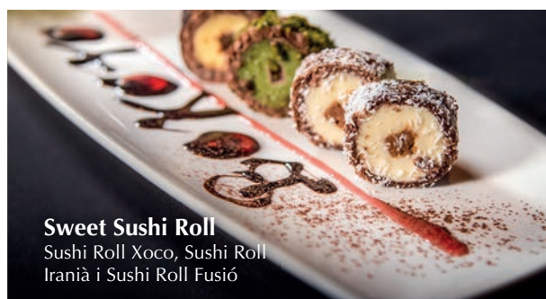
Sweet Sushi Roll Sushi Roll Xoco, Sushi Roll Iranià i Sushi Roll Fusió