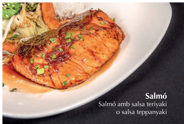
Salmó Salmó amb salsa teriyaki o salsa teppanyaki