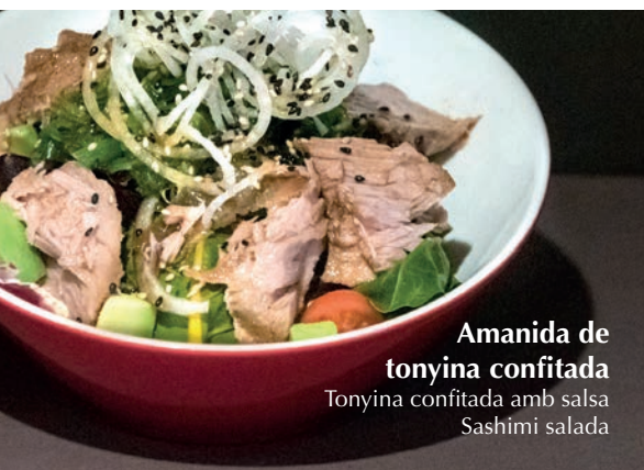
Amanida de tonyina confitada Tonyina confitada amb salsa Sashimi saladada