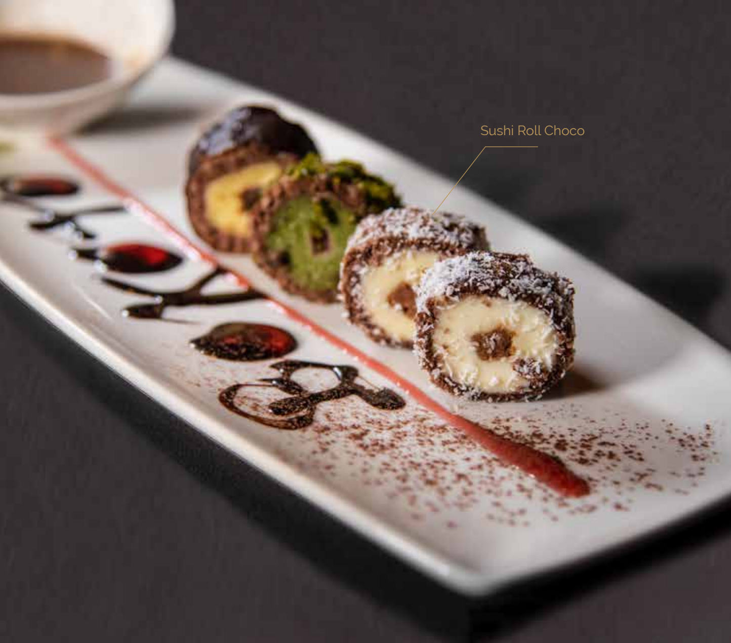
Sushi Roll Choco