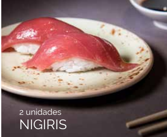
2 unidades NIGIRIS