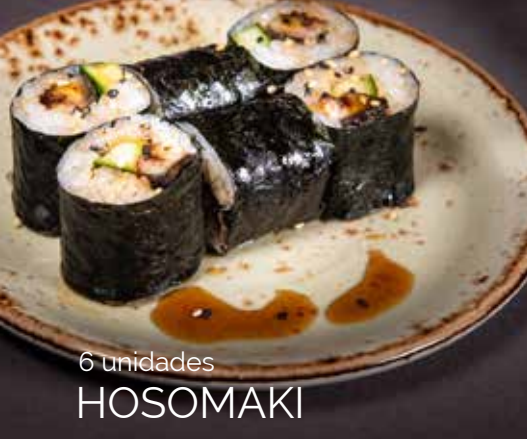
6 unidades HOSOMAKI