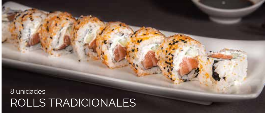
8 unidades ROLLS TRADICIONALES