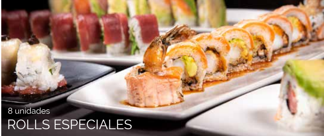
8 unidades ROLLS ESPECIALES